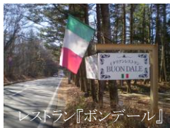
レストラン『ボンデール』

「軽井沢便り」、記念すべき第1号は、モデルハウスに内に併設しているイタリアンレストランのご紹介です。地元の旬の食材を使った南イタリア料理が中心で、おススメは自家製パスタだそうです。