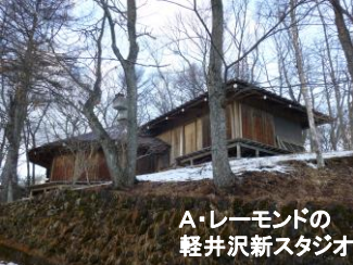
A・レーモンドの 軽井沢新スタジオ