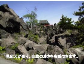
見応えがあり、自然の凄さを実感できます。