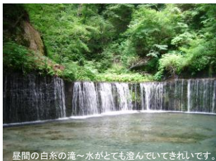
屋間の白糸の滝～水がとても澄んでいてきれいです。