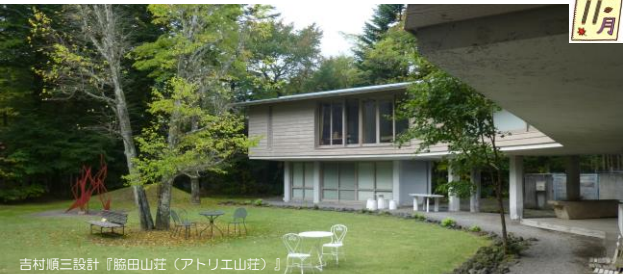
吉村順三設計『脇田山荘（アトリエ山荘）』

美術館の中庭にある、脇田氏のアトリエ山荘の見学でした。 これは、別荘建築の巨匠、吉村順三が設計した建物です。