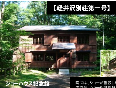
ショーハウス記念館