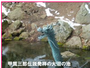
甲賀三郎伝説発祥の大沼の池