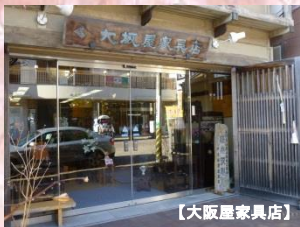
軽井沢彫り発祥のお店。明治41年開業。

明治時代、外国人別荘の増加に伴い、その頃日本で最も華麗な木彫細工の1つを作っていた日光の木彫り職人たちが軽井沢に呼ばれ、欧米人の別荘のために製作した家具が、現在の軽井沢彫りの原型になります。100年の歴史を持つ文化財です。