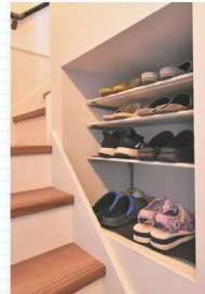
壁面に設けた棚もスリッパなどを置いて便利