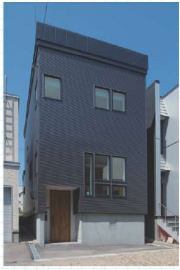
▲外観 外壁工事に併せ断熱を施し暖かさを確保。外階段がなくなると玄関周りがフラットになり、除排雪もしやすい