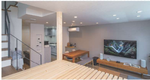
▶ロフトデッキ(平面図③) 家の構造上必要だった空間に実用性を持たせ、ご家族が思い通りに活用できる場所を創出