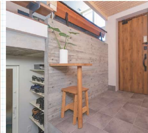
そばにシューズクロークがあり靴の収納・管理もスムーズ