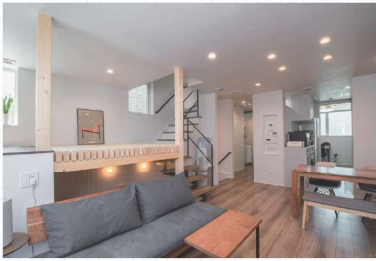
▲フロア全体 建具の壁を最小限に抑えることで広さを感じられ、開放的な雰囲気漂う。左上がロフトデッキ