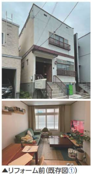
▲リフォーム前(既存図①)