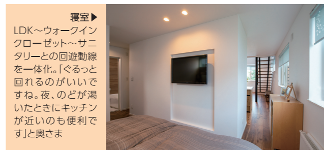
▲寝室 LDK~ウォークインクローゼット~サニタリーとの回遊動線を一体化。「ぐるっと回れるのがいいですね。夜、のどが渇いたときにキッチンが近いのも便利です」と奥さま