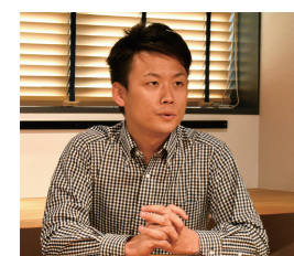
「お客さまの夢をかなえる空間を目指します!」と高田支店長。新たなことにも果敢に取り組み、若き支店長の一人です