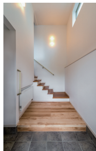
▲玄関 物置きだった空間を玄関にし、内階段を設置。玄関と車庫の移動がしやすく、またシューズクロークを別に作ったことでスッキリ、広々