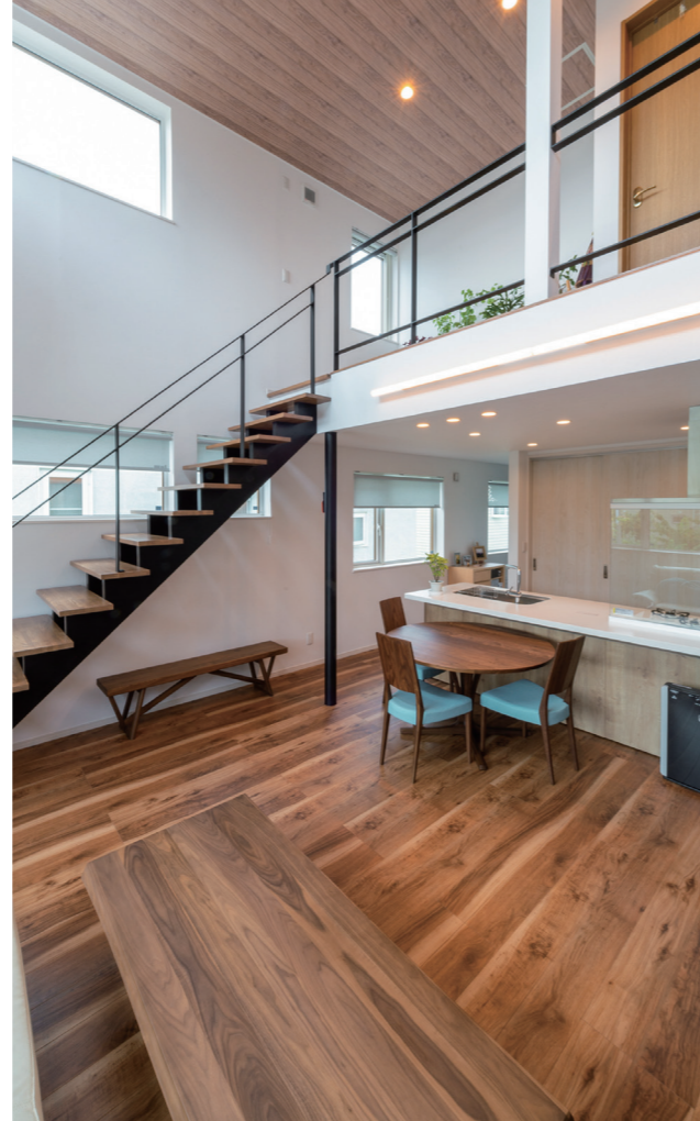
▲リビング 大きな吹き抜けにし、採光を確保。スチール柱と階段はご主人の愛車と同じ色に。またご主人は「昨年の夏は猛暑でしたが、帰宅しても暑がもっていなかったのには驚きました」と話します