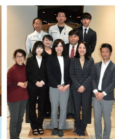
札幌中央支店 スタッフ一同