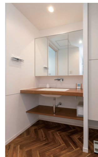
▲洗面 シンプルでホテルライクな仕様は使いやすさを重視。高身長のお二人に合わせ、洗面カウンターは高さ85cmに