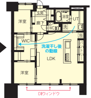
▲奥さまは洗濯干しの動線を熟慮、無駄な動きを極力抑えました

「DIウィンドウ」については詳しい資料をご用意しております。左記フリーダイヤルまでお気軽にご請求ください。