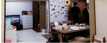
▲リビング・リフォーム後 約17帖のリビングダイニングは開放感があり、広々。断熱工事に加え、熱交換をしながら換気を行う二重サッシ「DIウィンドウ」を設置したことで冬の冷気や結露、夏の暑さを軽減することに