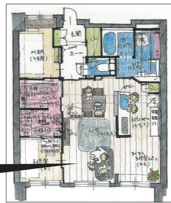
錠者社員が作成した図面。「温かみがあって、うちのことを考えてくれていると心を動かされました」と奥さま

リフォームをして2年。「家が変わって、生活スタイルまでも変わり、自分たちでも驚いています。家で悩んでいることを改善すると、こんなにも暮らしが楽になるのだと実感しています」とお二人はうれしい感想を伝えてくださいました。