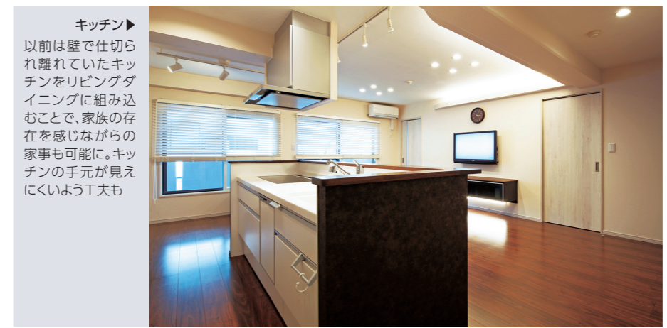
キッチン▶ 以前は壁で仕切られ離れていたキッチンをリビングダイニングに組み込むことで、家族の存在を感じながらの家事も可能に。キッチンの手元が見えにくい工夫も