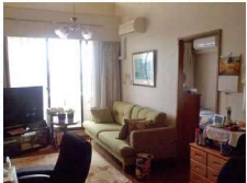
▲リフォーム前リビング