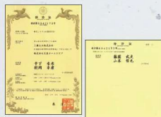
窓メーカーと共同開発して特許を取得したDIウインドウ換気システムの特許証

天井の高い、広々とした空間へと変ぼう。DIウインドウによる室温の快適さに加え、外で道路工事をしていても聞こえないほどの高い防音性を実現