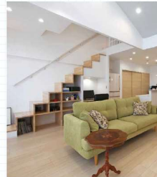
▲ロフト(平面図②) ロフトには従来のほしごから、家のサイズに合わせた階段を設置。奥さまの希望で階段は収納を兼ねる機能的な形に