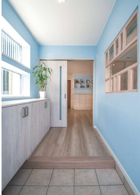
▲玄関ホール 爽やかな明るいブルーの壁紙を採用。ドアやリビングの棚にも同色をあしらうことで統一感のある印象に

明るくて開放感のある玄関が完成しました。玄関を新設するにあたり気遣ったのはキッチンの採光。格子窓にすることでデザイン性にもこだわりました。また玄関収納は低いタイプのものを採用することで圧迫感が出ないようにしています