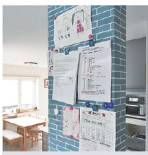
▲マグネット入り柱 外せなかった2階の柱にはマグネットを施し、便利な壁を創出。保育園のお手紙やお子さまの絵が貼られていました