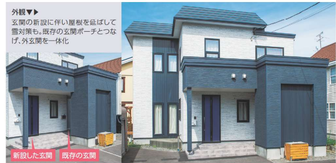
外観▼ 玄関の新設に伴い屋根を延ばして雪対策も。既存の玄関ポーチとつなげ、外玄関を一体化