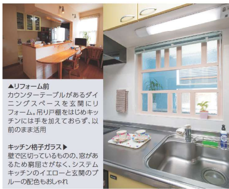
▲リフォーム前 カウンターテーブルがあるダイニングスペースを玄関にリフォーム。吊り戸棚をはじめキッチンには手を加えておらず、以前のまます活用