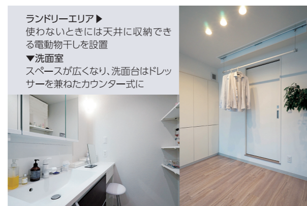
ランドリーエリア▶ 使わないときには天井に収納できる電動物干しを設置 ▼洗面室 スペースが広くなり、洗面台はドレッサーを兼ねたカウンター式に