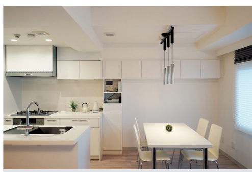
▲キッチン 間仕切りを撤去し、シンクをリビングと対面に