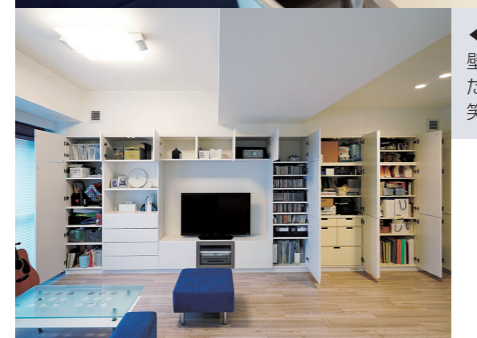
◀▲リビング 壁面収納により室内が散漫にならず、いつでもすっきり。「部屋に刺激を受けたのか、こまめに片づけていつでもきれいに意識するようになりました」と笑うご主人です