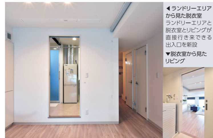
◀ランドリーエリアから見た脱衣室 ランドリーエリアと脱衣室とリビングが直接行き来できる出入口を新設 ▼脱衣室から見たリビング

▲本店 設計 根塚恵己子 お客様からの声 初めてお会いしたときから、私たちの思いに寄り添う提案をいただいたのが大変心強かった。脱衣室の広さもそうですが、図面で見たとときに描いたイメージ以上の仕上がりに感激しています