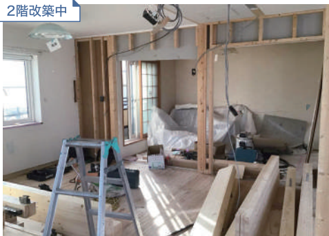
間仕切りを撤去し、洋室の一部をキッチンに改築